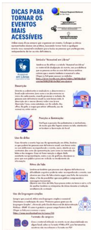
Figura 4: Folder – dicas para tornar os eventos mais acessíveis