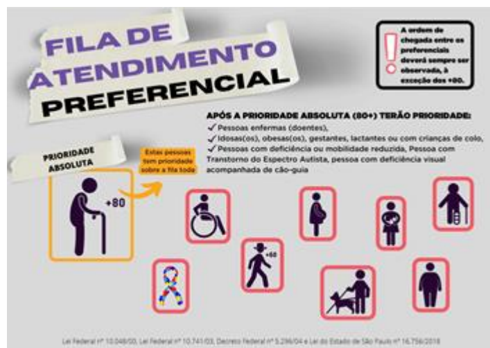
Figura 6: Panfleto com a fila de atendimento preferencial (reduzido)

De modo a permitir que o panfleto seja utilizado em diferentes situações que não seja no dia da votação, foi desenvolvida versão reduzida, sem as orientações específicas para as eleições.