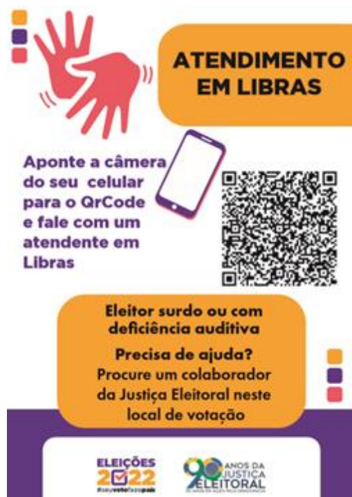
Figura 7: Cartaz do “Atendimento em Libras” que será afixado nos locais de votação da Capital

afixados nos locais de votação da Capital, visando ampliar o direito de acesso ao voto da(o) eleitora(o) surda(o) ou com deficiência auditiva.