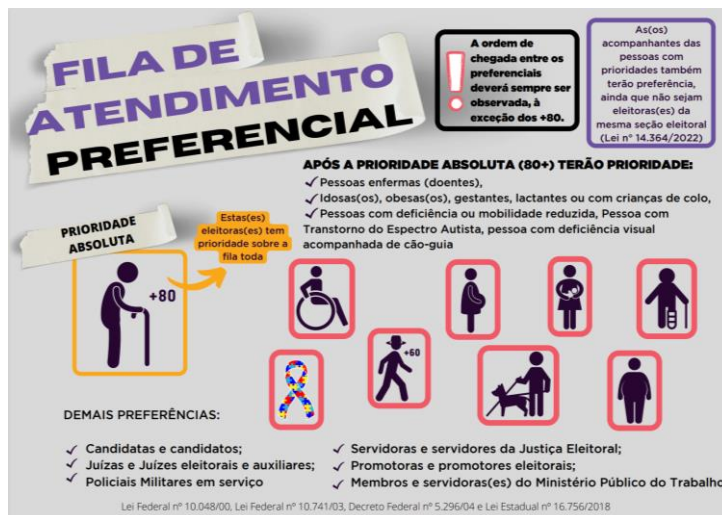
Figura 5: Panfleto com a fila de atendimento preferencial