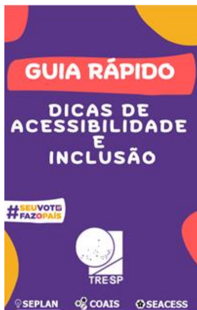
Figura 3: Capa do Guia Rápido – dicas de acessibilidade e inclusão