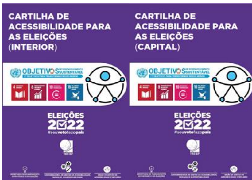
Figura 2: Capas das Cartilhas de Acessibilidade para as Eleições 2022 – versões interior e capital, respectivamente.

Destaca-se que a Cartilha de Acessibilidade para as Eleições 2022 do TRE-SP foi utilizada como referência para a elaboração de materiais das eleições 2022 de outros Tribunais Regionais Eleitorais (TRE/TO e TRE/PB). Por sua vez, o Tribunal Regional Eleitoral do Distrito Federal – TRE/DF, autorizado pelo TRE/SP, reproduziu na íntegra a referida cartilha no âmbito daquele Regional.